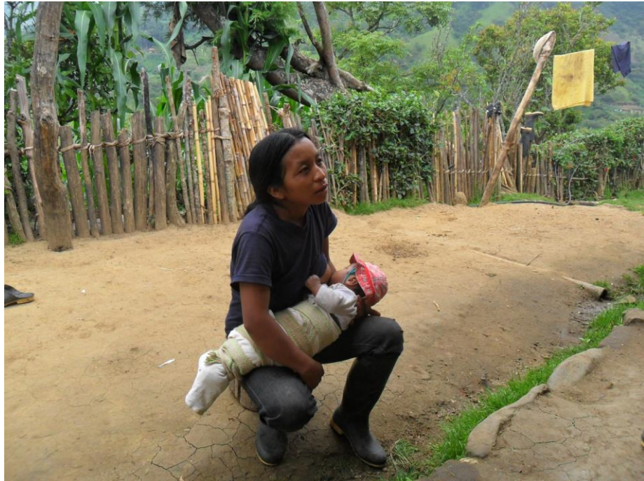
Madre beneficiaria del programa CDI, modalidad familiar, vereda Zumbico de Jambaló, mostrando una práctica cultural con su hijo (enchumarlo)