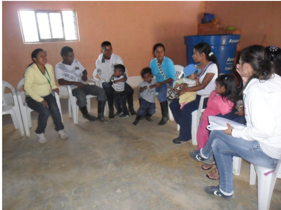
Madres y padres de familia de la vereda Zumbico, municipio de Jambaló – Cauca. ¿Qué prácticas culturales le transmite o le enseña a su hijo o hija