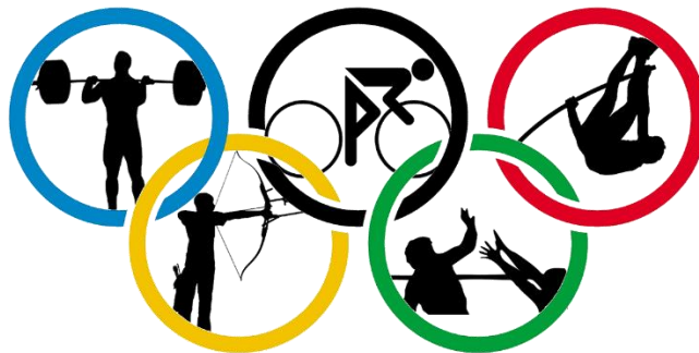
Figura 1. Insignias deportivas