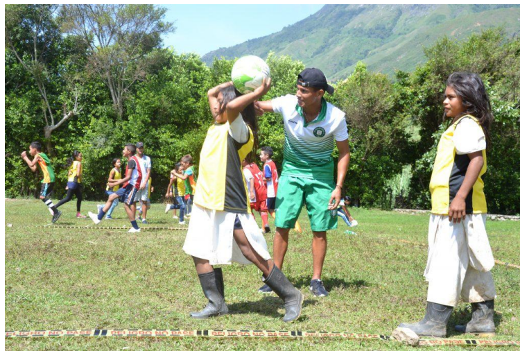
Figura 2. Formación deportiva en edades tempranas