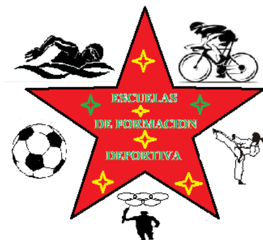
Figura 3. Escuelas de formación deportiva